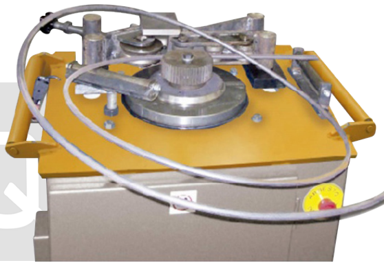
ACCESORIO PARA HACER ESPIRALES