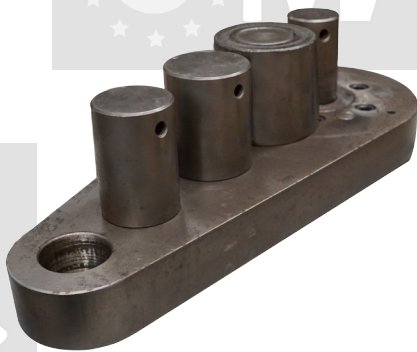
INVERSOR DE GIRO IZQUIERDA- DERECHA